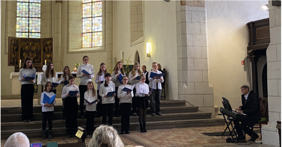
Der Musikalische Gottesdienst am 2. März 2025 wurde von der Jugendkantorei unter Leitung von Kantor Stefan Mücksch mitgestaltet. Dank an alle jungen Sänger.