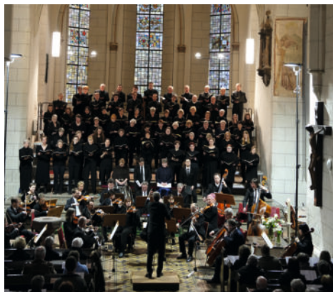
„Stabat Mater“ 2023